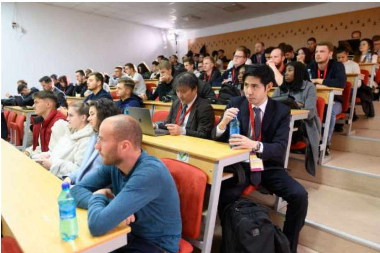
Fig.6 Aspect al auditoriului conferinței

Prin tematica și conținutul lucrărilor prezentate, urmată de dezbateri și schimburi de idei asupra rezultatelor desprinse din studiile de cercetare întreprinse, manifestarea științifică a contribuit