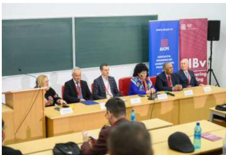
Fig. 4 Prezidiul de la deschiderea lucrărilor conferinței