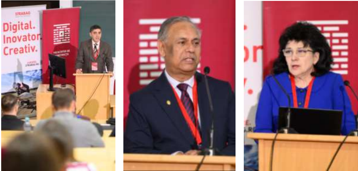
Fig. 5 Aspecte de la prezentările în Sesiunea plenară

Prezentarea lucrărilor a debutat în Sesiunea plenară, printr-un număr de șase autori de la Tanta University, Egypt; Shenyang Jianzhu University, China; Faculty of Mechanical Engineering University of Belgrade; University of Osijek, Croatia; Universitatea Tehnică „Gheorghe Asachi” Iasi, urmată de lucrările prezentate in sesiunile paralele, care au susținut din plin interesul și aprecierile auditoriului prezent, Fig.5, Fig. 6.