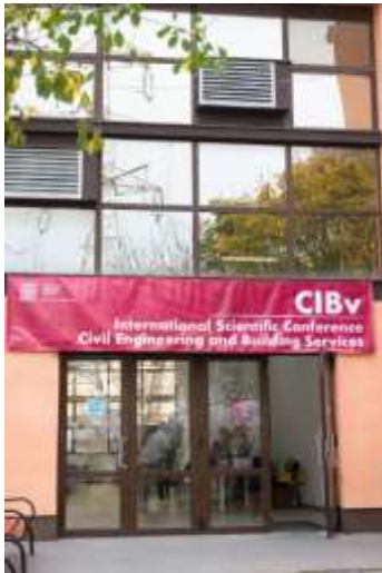
Fig. 2 Intrarea în amfiteatrul Facultății de Construcții

Deschiderea lucrărilor a fost onorată și prezidată de reprezentanți ai instituțiilor de învățământ superior organizatoare, a mediului academic și universitar din țară și străinătate, care au transmis prin luările de cuvânt, mesaje de felicitare și apreciere asupra nivelului științific înregistrat de această manifestare, prin calitatea lucrărilor prezentate și prin sporirea de la un an la altul, a numărului de participanți din afara țării, Fig.2; Fig. 3; Fig. 4.